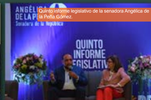
Quinto informe legislativo de la senadora Angélica de la Peña Gómez.