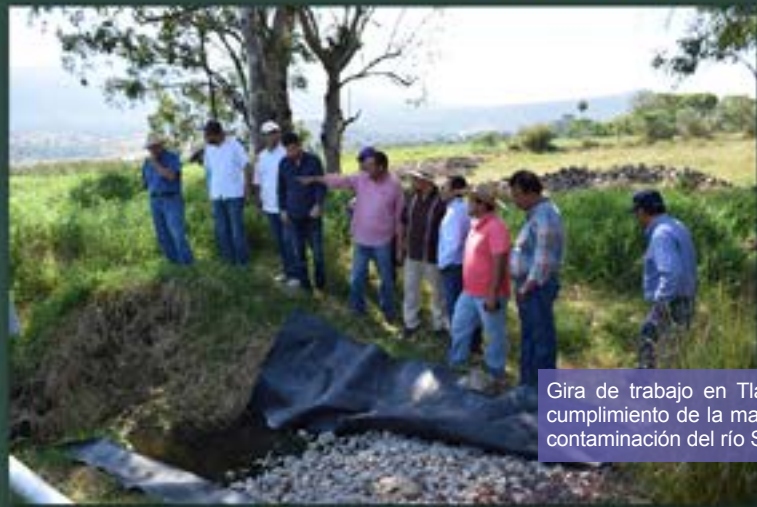
Gira de trabajo en Tlajomulco para verificar el cumplimiento de la macrorrecomendación por la contaminación del río Santiago.