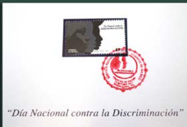
"Día Nacional contra la Discriminación"