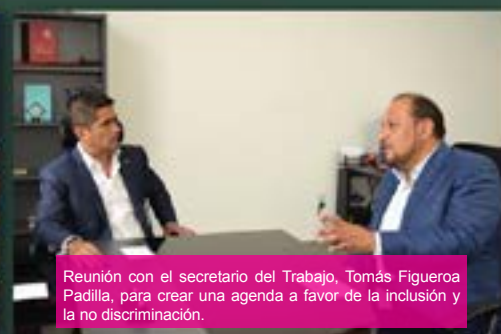
Reunión con el secretario del Trabajo, Tomás Figueroa Padilla, para crear una agenda a favor de la inclusión y la no discriminación.