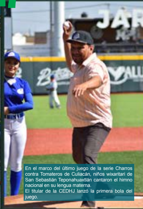
En el marco del último juego de la serie Charros contra Tomateros de Culiacán, niños wixaritari de San Sebastián Teponahuaxtlán cantaron el himno nacional en su lengua materna. El titular de la CEDHJ lanzó la primera bola del juego.