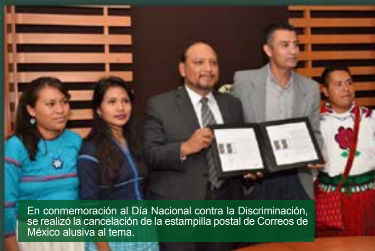
En conmemoración al Día Nacional contra la Discriminación, se realizó la cancelación de la estampilla postal de Correos de México alusiva al tema.