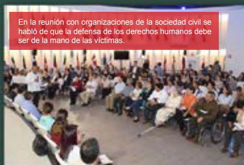
En la reunión con organizaciones de la sociedad civil se habló de que la defensa de los derechos humanos debe ser de la mano de las víctimas.