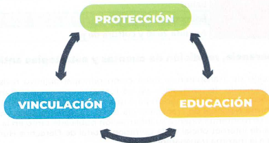
Diagrama de procesos