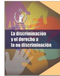
La discriminación y el derecho a la No Discriminación