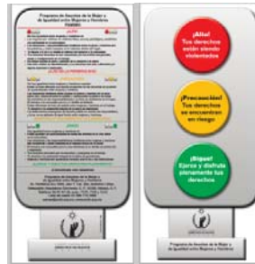
Programa de Asuntos de la Mujer y de Igualdad entre Mujeres y Hombres