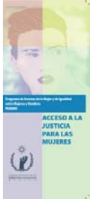
Acceso a la Justicia para las Mujeres