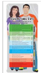
Igualómetro: Medidor de Igualdad en la Relación de Pareja