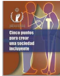
Cinco puntos para crear una sociedad Incluyente