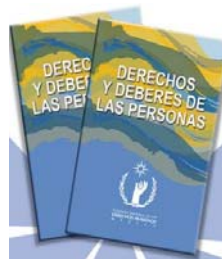
Derechos y Deberes de las Personas