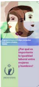
¿Por qué es importante la igualdad laboral entre mujeres y hombres?